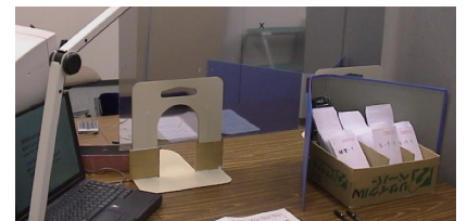
実験状況の一例。マジックミラー越しに 2 人でやりとりをさせて、相手に対する認知を調べる。

国立科学博物館認定サイエンスコミュニケーター（5 期）。現在、青山学院女子短期大学准教授。専門は社会心理学、ヒトと動物の関係学など。趣味はスキューバダイビング。最近、日本安全潜水協会認定アンダーウォーター・インタープリターとしての活動も模案中。